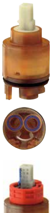
limitatore di portata e temperatura LPT adjustable flow rate and temperature limiter LPT