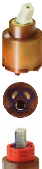
limitatore di portata e temperatura LPT adjustable flow rate and temperature limiter LPT